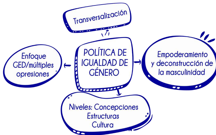
Esquema 1. Conceptos/teorías que acompañan la política

Partimos enmarcando las conceptualizaciones y referentes teóricos desde los que parte la presente Política de Igualdad de género que apuesta a considerar los múltiples sistemas de opresión/poder que atraviesan las personas.