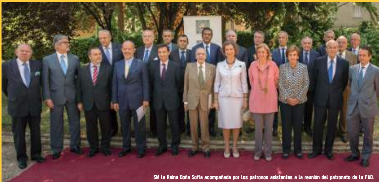
SM la Reina Doña Sofía acompañada por los patronos asistentes a la reunión del patronato de la FAD.