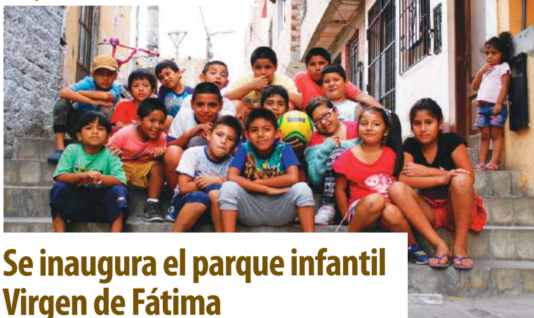
Niños y niñas del distrito de La Victoria de Lima.